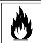
Produkt skrajnie łatwopalny

Oznakowanie zagrożenia: Produkt drażniący; Produkt skrajnie łatwopalny